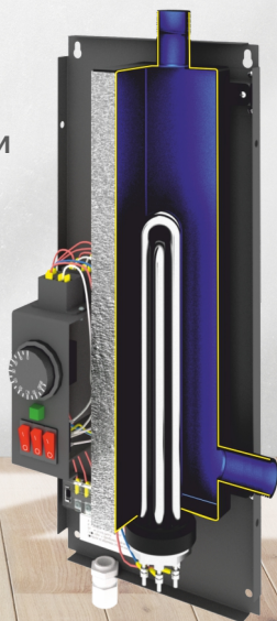
Котел без корпуса Спутник 6/9