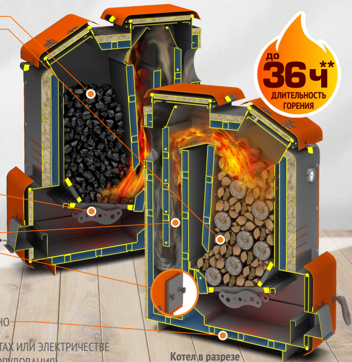
Котел в разрезе Куппер МЕГА 20