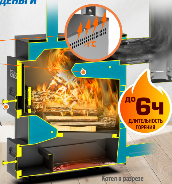
Котел в разрезе Куппер Практик-14 (1.1)