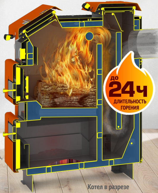
Котел в разрезе Куппер Эксперт-15 (2.0)