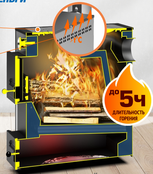
Котел в разрезе Куппер Практик-16 В