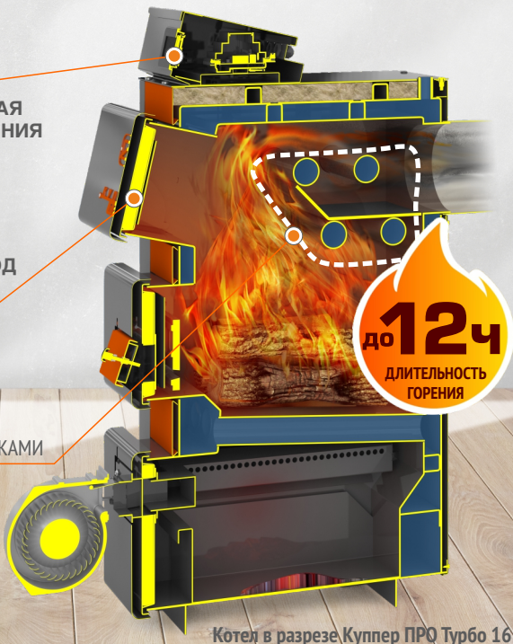
Котел в разрезе Куппер ПРО Турбо 16